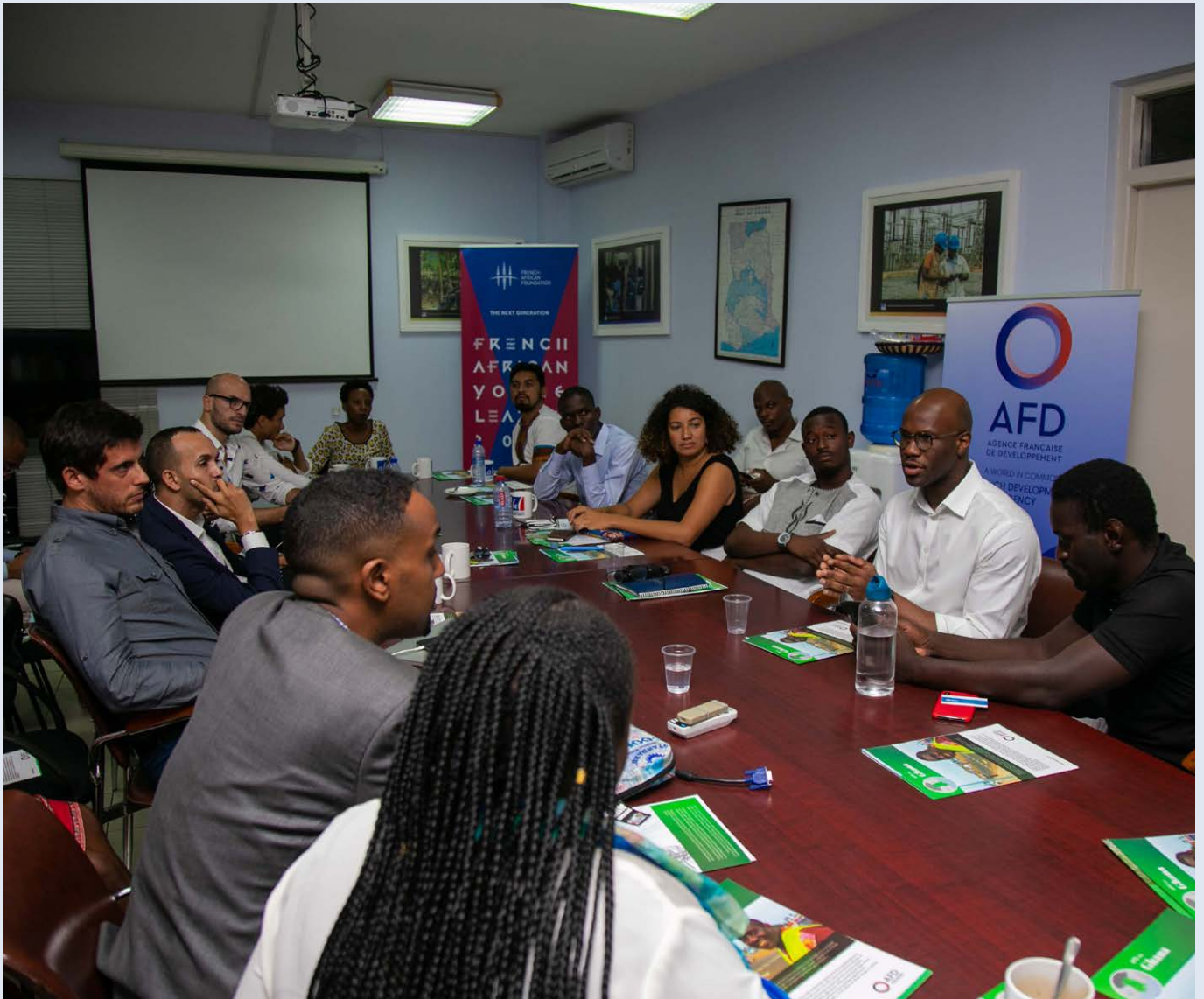
Rencontres business avec des entrepreneurs Ghanéens (Décathlon, R&R Luxury, 57Chocolates)