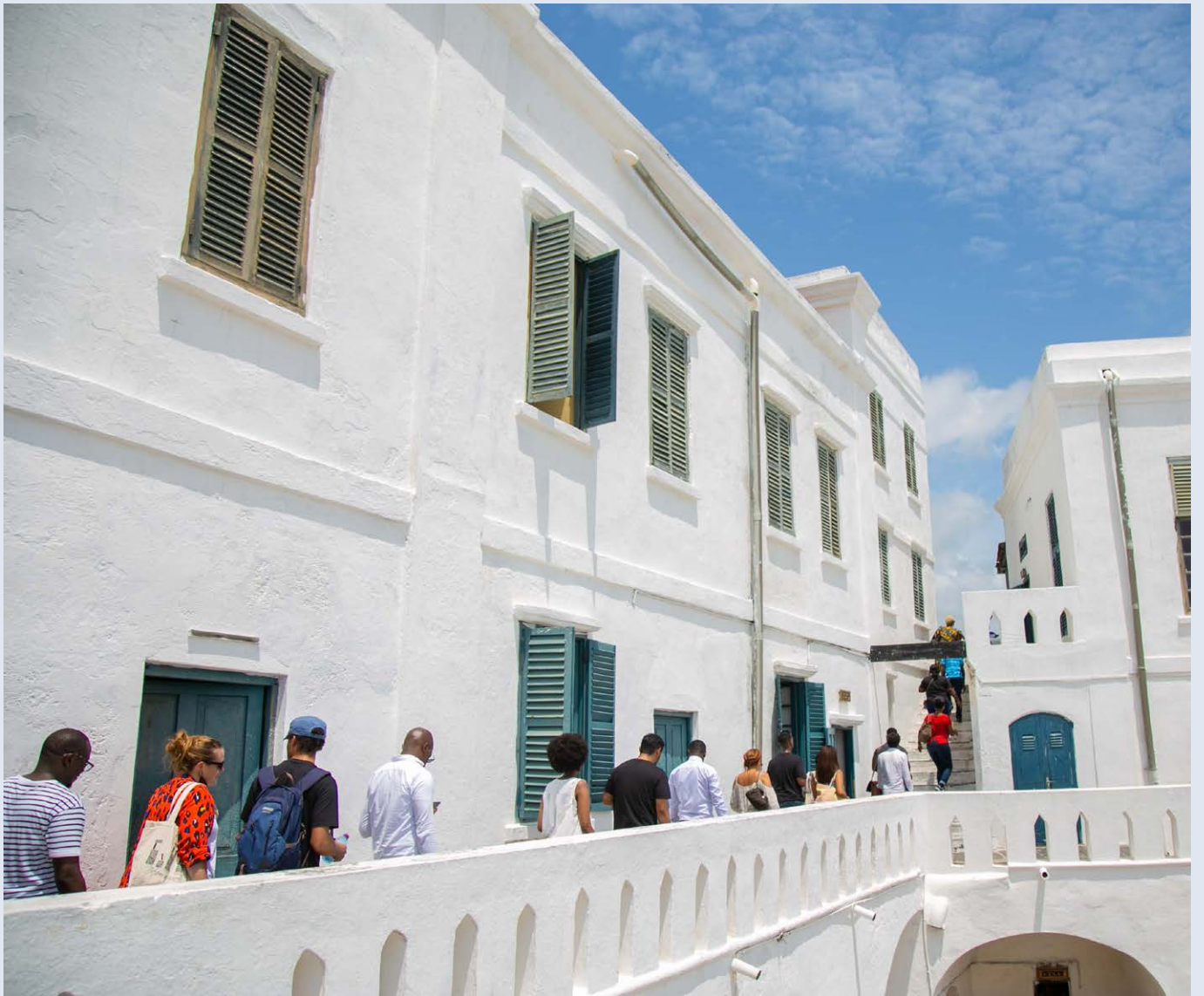
Visite de Cape Coast, patrimoine mondial de l'Unesco