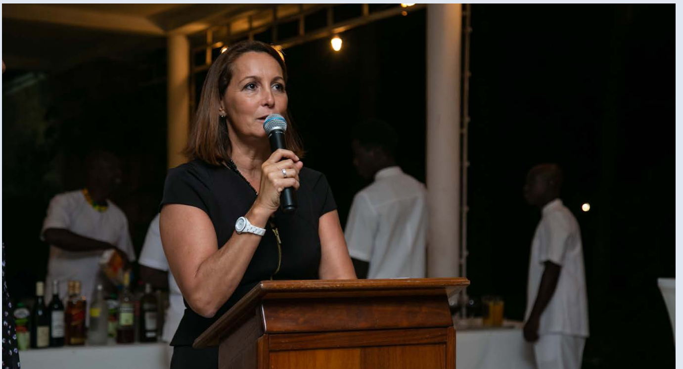
Cocktail à l'Ambassade de France au Ghana, avec Mme l'Ambassadeur, Anne-Sophie Avé