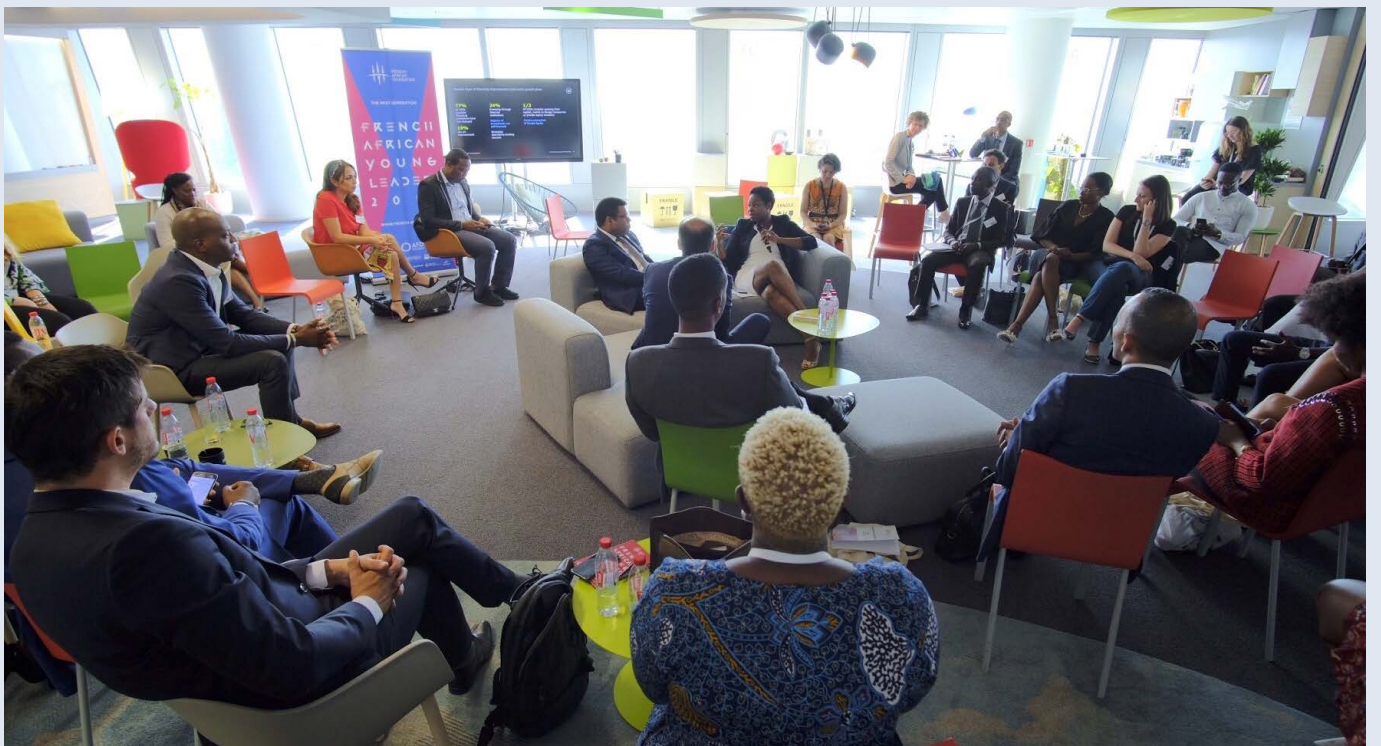
Workshops : Ressources humaines, Stratégie, Transformation des économies africaines, Leadership,...