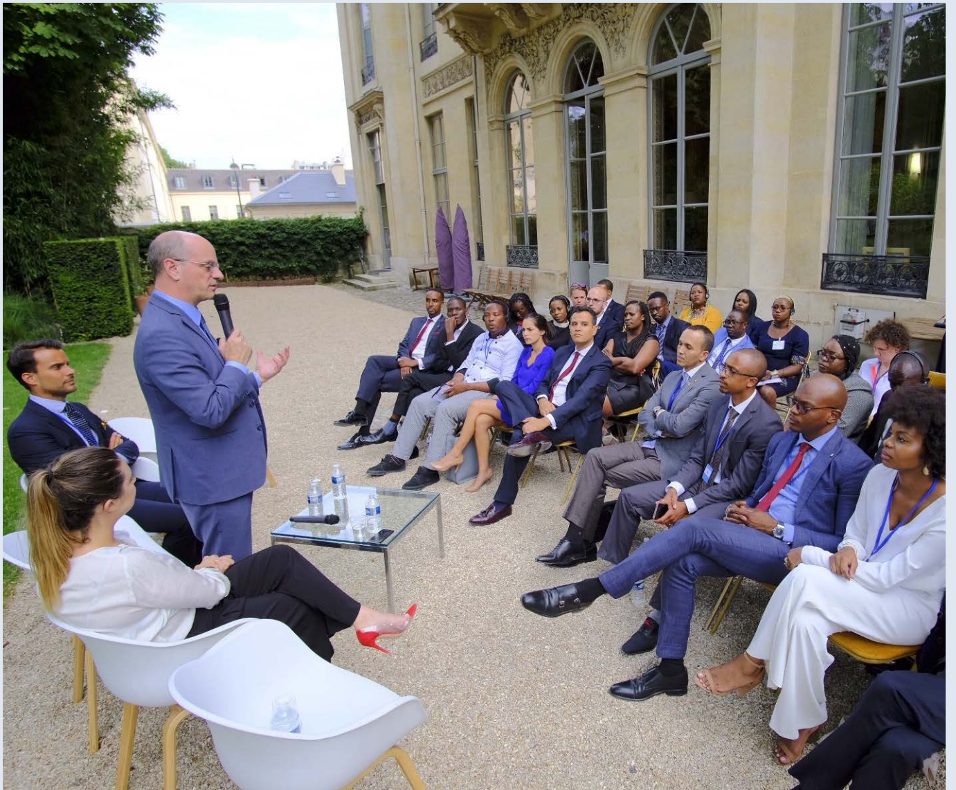
Rencontre avec M. Jean-Michel Blanquer, Ministre de l'éducation nationale et de la jeunesse