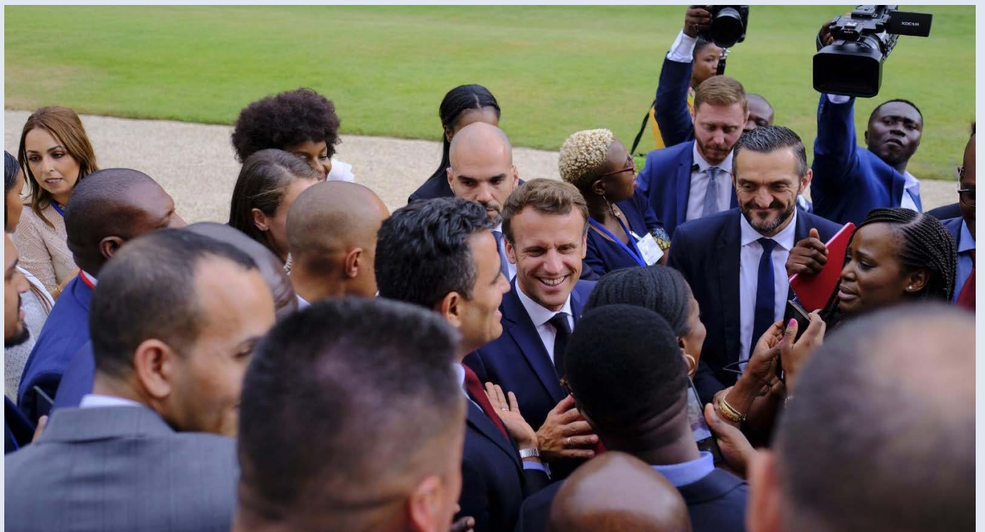
Séquence Présidentielle en présence de M. Emmanuel Macron, Président de la République Française et de M. Nana Akufu Addo, Président de la République du Ghana