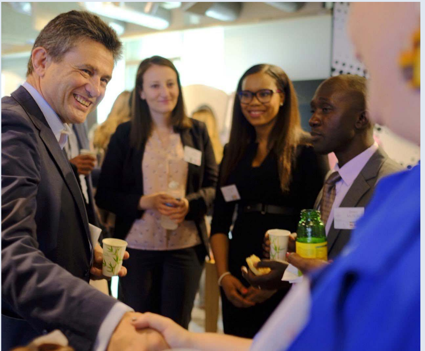
Petit déjeuner avec Henri de Castries, Institut Montaigne