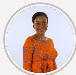
KONE-DICOH Khady Côte d'Ivoire, France