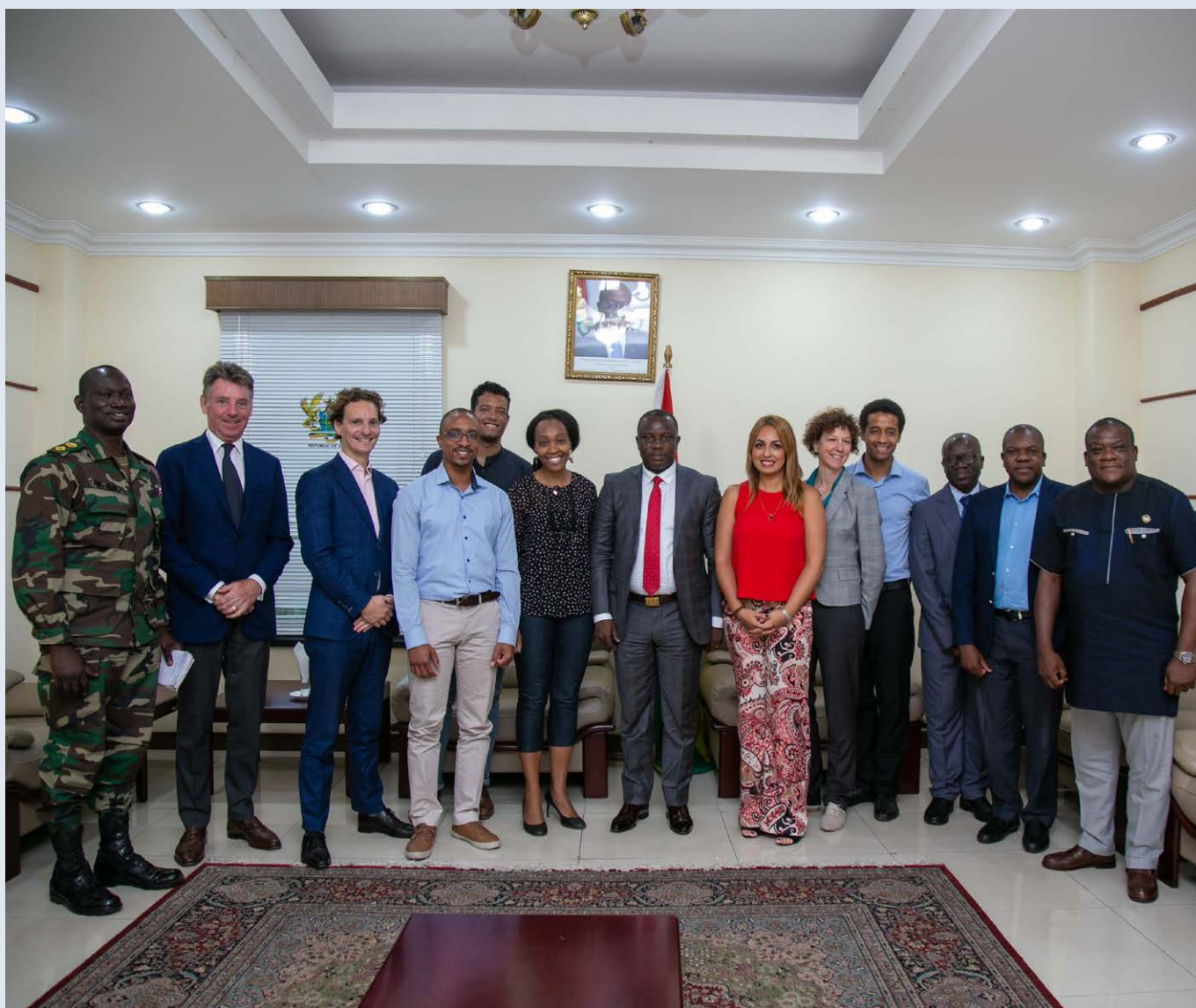
Rencontre avec M. Dominic Nitiwul, Ministre de la Défense du Ghana