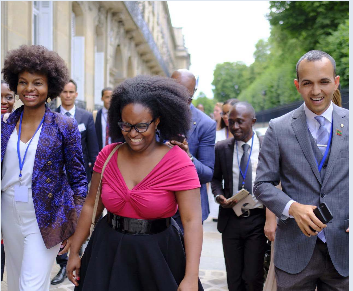
Rencontre avec la Porte-Parole du Gouvernement, Sibeth Ndiaye